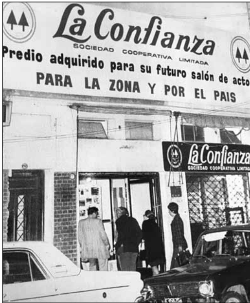
La caja de crédito "La Confianza".