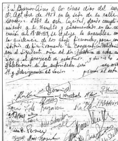
Acta Constitutiva de la cooperativa con su nombre original "Solidaridad".

La Caja es inscripta formalmente bajo el nombre "La Confianza" y se abrió a todo el público con operatoria cotidiana desde el 13 de diciembre de 1961 en Sanabria 2258/2260. "La apertura era un paso positivo, y algunos que tuvieron esa resistencia o albergaron dudas, después también fueron