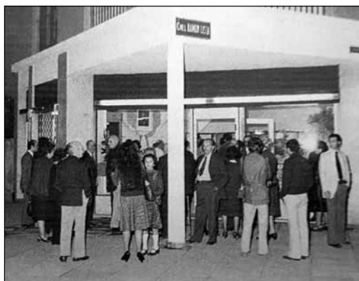
La inauguración de la filial de Ramón Lista (1978), La Confianza Cooperativa Limitada.

La caja de crédito "La Confianza" nació, como otras tantas de la Argentina, dentro de una mutual judía que solo operaba con los socios de la mutual y con montos muy reducidos. A partir del gran crecimiento del IMFC, a principios de la década del 60, empieza a ganar fuerza al interior de varias de las cajas mutuales la idea de la operatoria abierta. Este es el caso de la cooperativa La Solidaridad. Como explican los protagonistas de la época, esta pequeña Caja estaba incluida dentro del club social "Zcolowski", y fue creada por los jóvenes involucrados en el movimiento lcuquista, para principios de los años 60, con la incorporación de nuevos jóvenes militantes de la izquierda, comienza a ganar fuerza la operatoria abierta. Para esto, como se desprende de los relatos de los antiguos dirigentes, son invitados