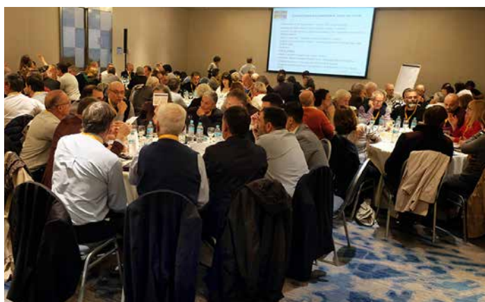
foto: Taller de Coyuntura.

se expresa en una actividad pública en la cual se otorgan donaciones a Entidades de la Economía Social para colaborar en todo sentido con las iniciativas de las organizaciones solidarias. Se realiza así un encuentro fraterno en la cual se comparten sueños, ideas, proyectos y se reconocen realizaciones de las cooperativas hermanas o de otras entidades de la economía social y popular. Este año se entregaron 785 reconocimientos.