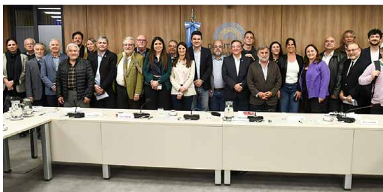
Encuentro parlamentario en Diputados.

El 11 de septiembre se realizó en la Cámara de Diputados el Encuentro Parlamentario por el 2025 Año Internacional de las Cooperativas, convocado por la Comisión de Asuntos Cooperativos y la Confederación Cooperativa de la República Argentina (Cooperar), con el respaldo de la Alianza Cooperativa Internacional (ACI). La jornada reunió a legisladores/as, asesoras/es y referentes de todo el país para debatir sobre el presente y futuro del sector.