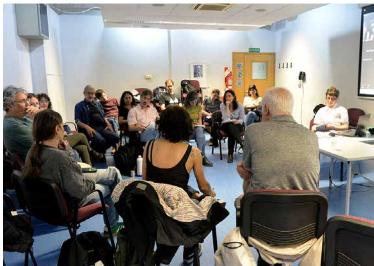
Comunicar para transformar.

El encuentro comenzó con un diagnóstico compartido sobre las dificultades en la búsqueda y desarrollo de estrategias de comunicación del sector. Al mismo tiempo, se destacó la relevancia de poder mejorar y sostener las acciones en marcha como parte de una política para visibilizar demandas y actores, pudiendo difundir, y así también multiplicar, otras y nuevas formas de entender