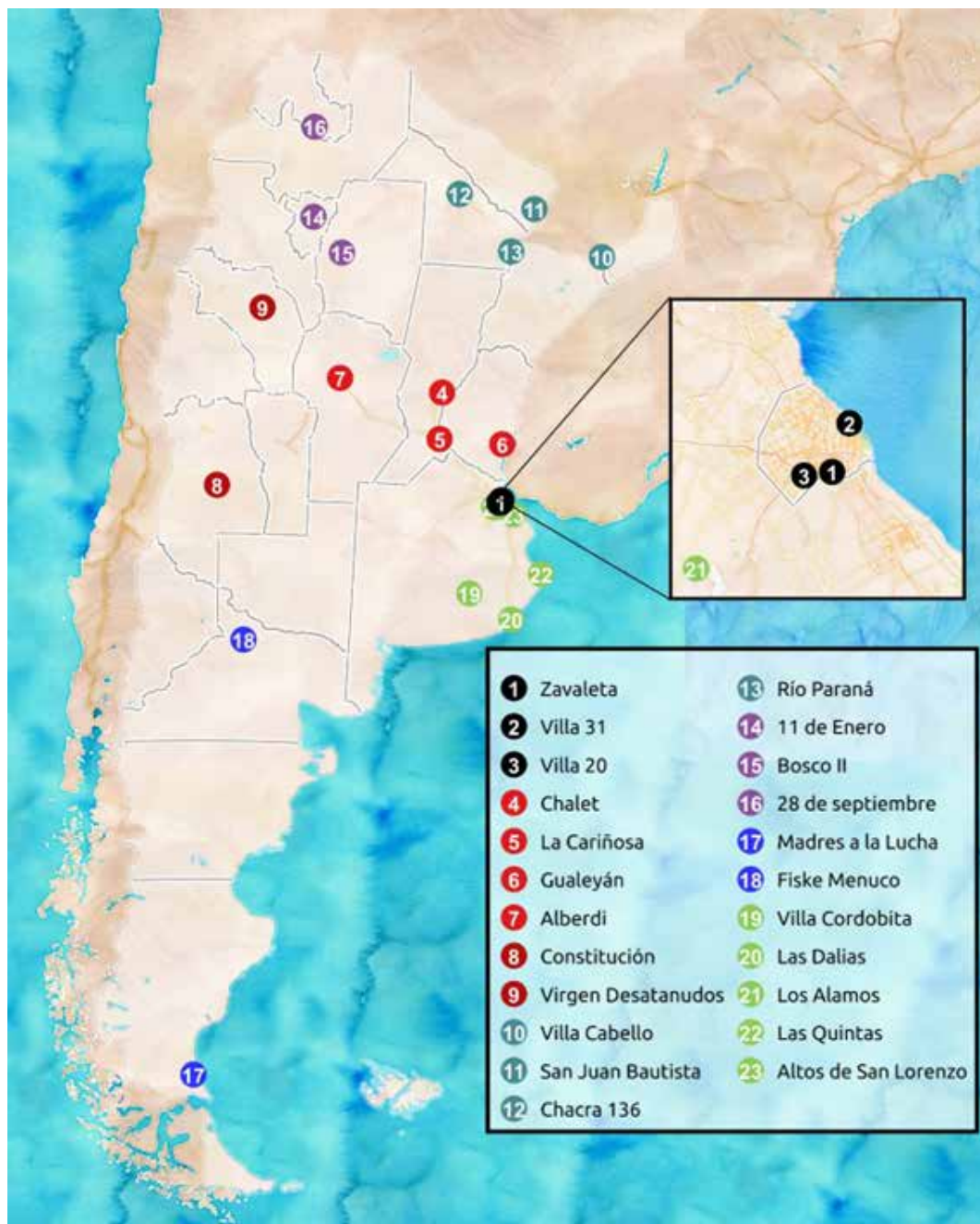
Figura 1: Mapa de los barrios populares relevados