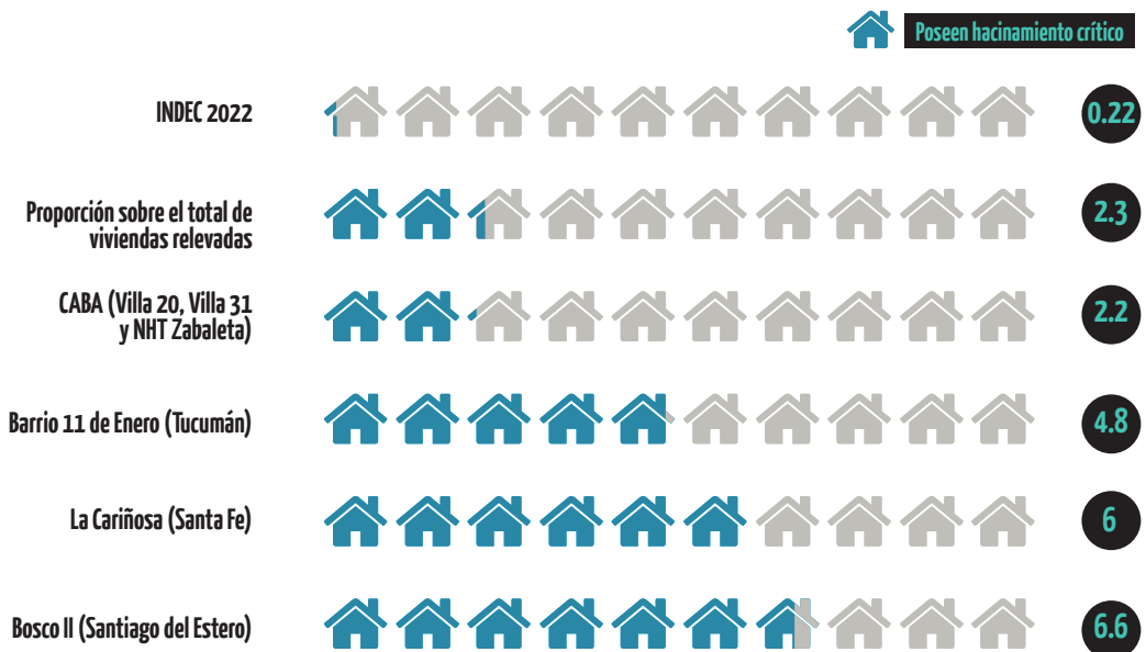
Figura 2: Proporción de viviendas con hacinamiento crítico